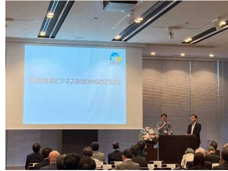
新規気象ビジネス創出 WG の活動紹介の様子