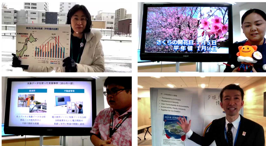
地方からの中継の様子

WXBC 会員によるプレゼンテーションでは、計 10 名の方が、各 3 分ずつ、スライド 1 枚のみで、今後の展望や今後提供するサービスの紹介、ビジネスパートナーの募集等、「これからの気象ビジネス」につながる話題提供をしていただきました。各スライドは会場の後方のスペースに掲示され、歓談の時間には発表者と来場者の皆様とで議論する様子が見られました。