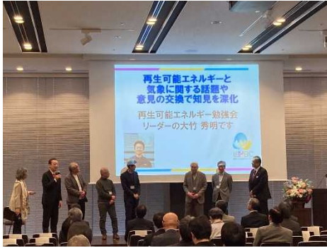
人材育成 WG の活動紹介の様子