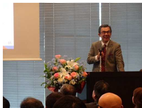
越塚教授の講演の様子